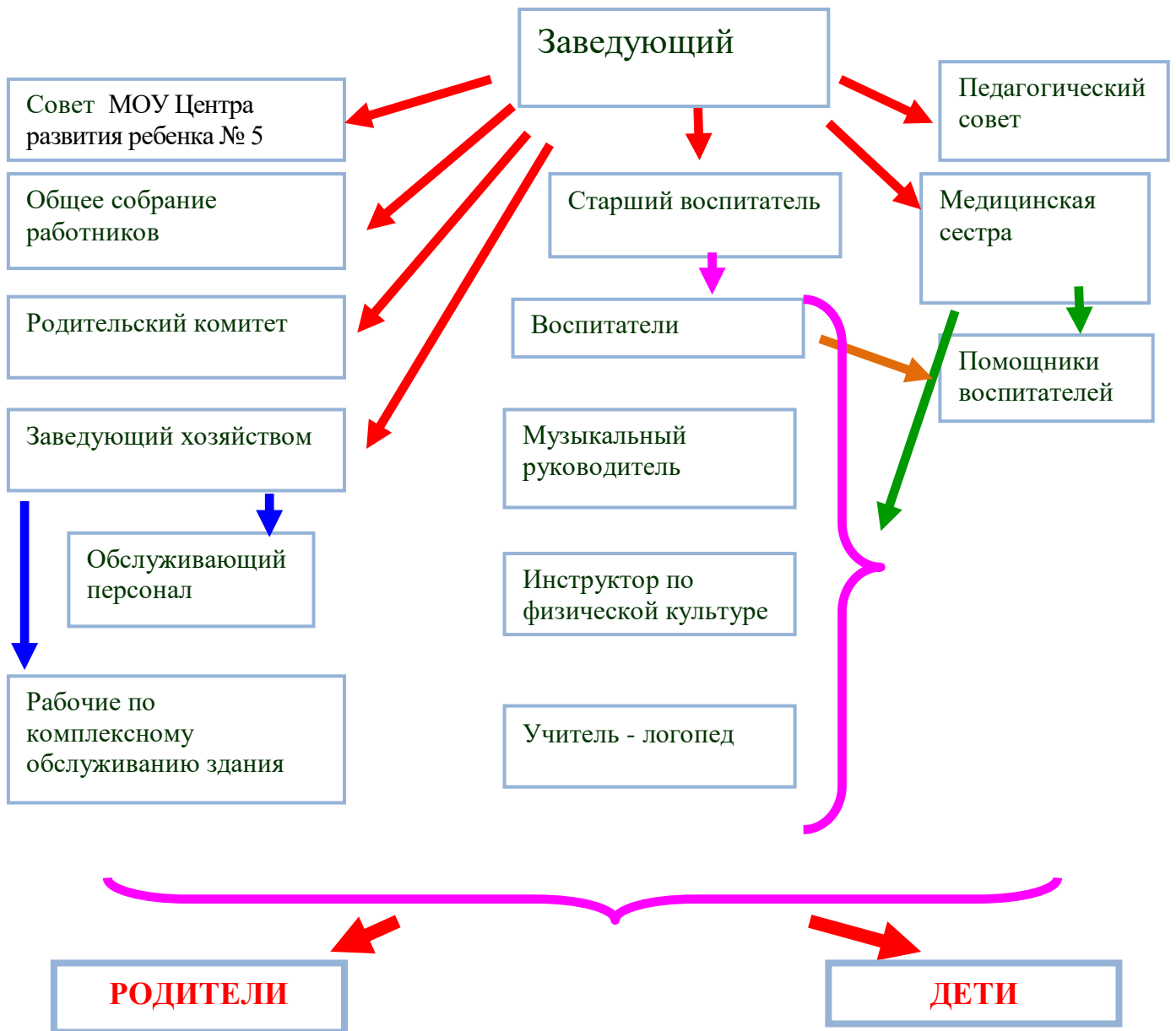
Схема структуры управления МОУ